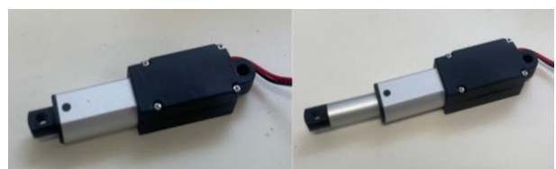
図3 使用するアクチュエーター(左:収縮時 右:伸長時) このサブ基板を合計で5枚用意し、1つのメイン基板に