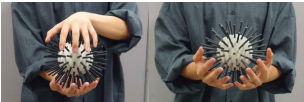
図4 様々な筐体の持ち方

立体音響と球体の触覚提示を組み合わせた先行事例としてatmoSphereがある[14]。提案装置は立体形状が提示できる特徴を生かすことで、全周囲を8分割した方向に触覚提示することを可能にしている。この時、全周囲への触覚提示と立体音響を組み合わせることで、クロスモーダルな音響体験を提案している。