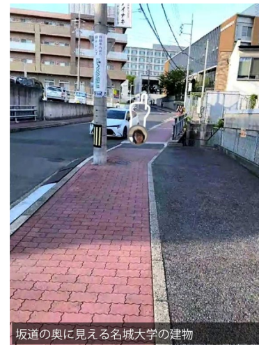
坂道の奥に見える名城大学の建物

外に出たら 右折 し、道なりに進みます。右側に 黄色テント で赤文字の「らーめん あ・うん」が見えたら、 右折 です。あ・うんと不動産屋のエイブルとの間の道をまっすぐ進みます。