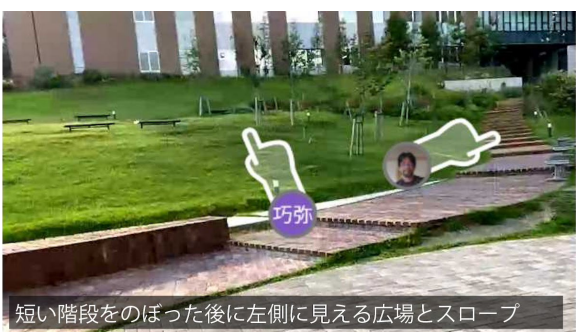
短い階段をのぼった後に左側に見える広場とスロープ

正面の階段を登り、右側の建物にあるファミリーマートを横目にさらに短い階段を登ると左側に広場が開けます。広場のレンガ造りのゆるい階段風スロープを上ります。