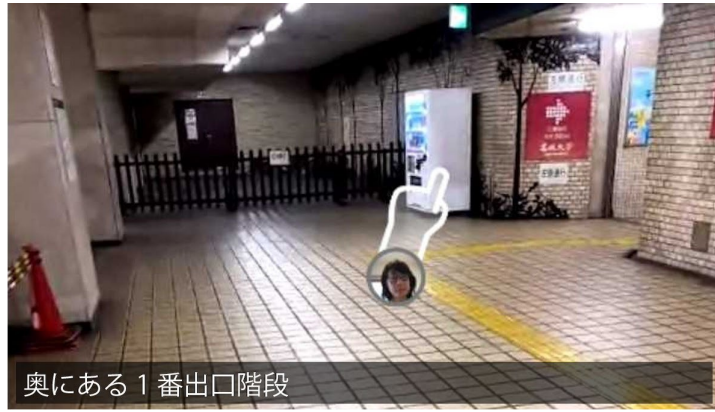
奥にある1番出口階段

塩釜口駅改札口を出て最初の注意ポイントです。表札では名城大学方面は3番へとありますが、 VR学会会場へ向かうみなさんは1番出口をご利用ください