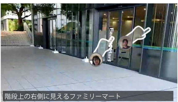
階段上の右側に見えるファミリーマート