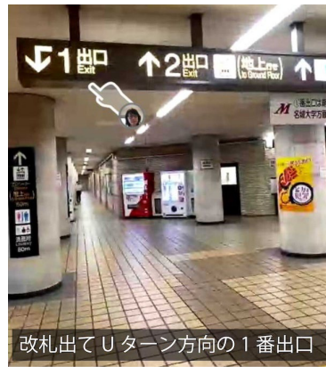
改札出てUターン方向の1番出口