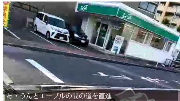
あ・うんとエーブルの間の道を直進