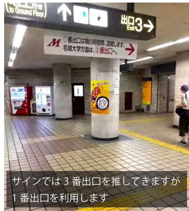
サインでは3番出口を推してきますが1番出口を利用します

塩釜口駅の1番出口かららーめん あ・うんを右折して名城大学研究実験棟II前の門から向かう最短ルート