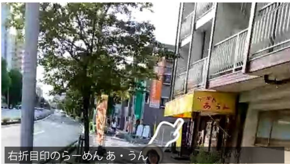
右折目印のらーめん あ・うん

塩釜口駅改札口を出て最初の注意ポイントです。表札では名城大学方面は3番へとありますが、 VR学会会場へ向かうみなさんは1番出口をご利用ください