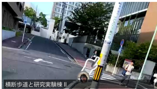
横断歩道と研究実験棟 II