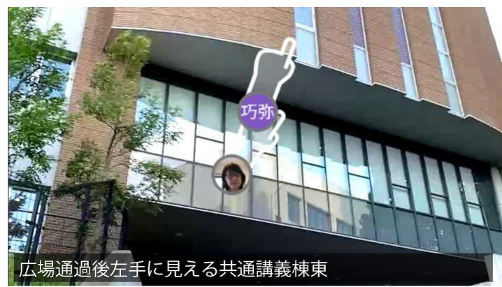
広場通過後左手に見える共通講義棟東

正面の階段を登り、右側の建物にあるファミリーマートを横目にさらに短い階段を登ると左側に広場が開けます。広場のレンガ造りのゆるい階段風スロープを上ります。