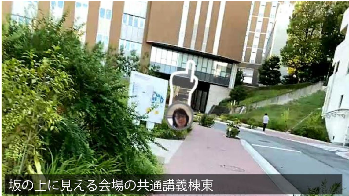
坂の上に見える会場の共通講義棟東

道に沿ってまっすぐ進み、左側にレンタカーの旗が見えたら左折、名城大学の東門をくぐりレンガ造りの坂道を直進です。