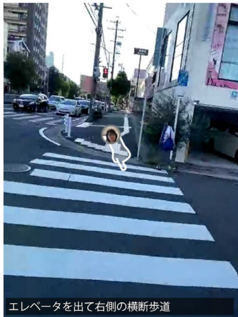
エレベータを出て右側の横断歩道

塩釜口駅改札を出てエレベータの標識のある方向へ直進し右側の青いゲートの向こうがエレベーター乗り場です。