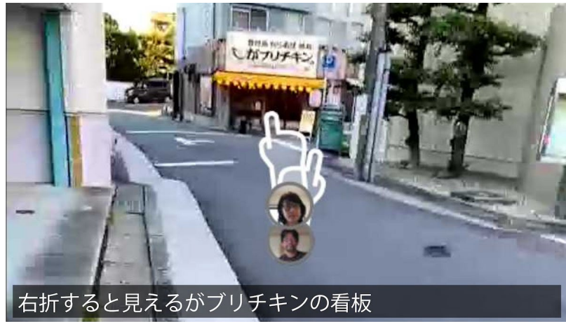
右折すると見えるがブリチキンの看板

地上に出たら右側にある短い横断歩道を渡りすぐ右折。正面右側に「ガブリチキン」のお店が見えたら正しい道です。横断歩道を渡らず右折しても良いですが、途中の歩道が狭くなるので横断歩道を渡り右折するのをお勧めします。