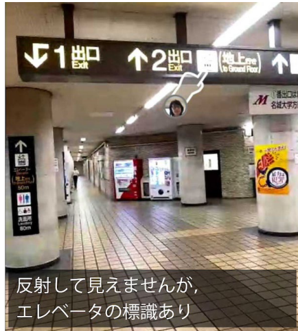
反射して見えませんが、エレベータの標識あり