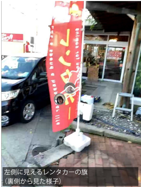
左側に見えるレンタカーの旗 (裏側から見た様子)