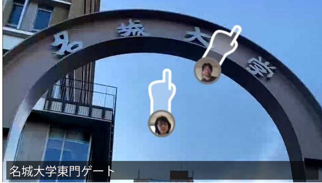
名城大学東門ゲート

道に沿ってまっすぐ進み、左側にレンタカーの旗が見えたら左折、名城大学の東門をくぐりレンガ造りの坂道を直進です。