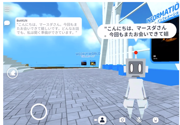
図 1: cluster 上でのエージェントとの会話の様子

ここで、前述の情報同期の問題などを解決した上で、すでに多人数が参加して交流を行っている VR 環境としてソーシャル VR プラットフォームが存在し、よく知られたものとして VRChat がある。VRChat は世界最規模の参加者を抱え、アバタの表現やバーチャル空間の構造について制約が少なく、実験フィールドとしての利用も可能なプラットフォームである。しかし、VRChat において、バーチャル空間内の情報をエージェントに伝えたり、VRChat 内のア