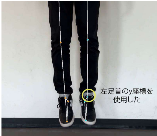
図 1: BlazePose で姿勢推定した例の一部