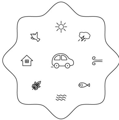
図 3: 本技術の応用例: 音環を発現させる EV (イメージ)

acoustic equipment), 遠隔音楽 (telematic music), AI 音楽 (AI music), 音楽療法 (music therapy), 音楽瞑想 (music meditation), 電動車両 (electric vehicle), 又はスマート音楽アプリ (smart music app). 図 3 は, 或る EV が様々な環境音から或る音環 (波円) を発現させて走行するイメージを示す。(産業上の利用可能性)