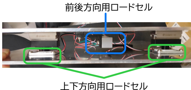
図 2: 力検出装置の構造

感覚刺激と組み合わせて、安静状態のユーザーに歩行感覚を提示する手法を提案している。しかし、筆者らの知る限りでは、ユーザーによる能動的、随意的な歩行の感覚を運動錯覚によって増強した例は存在しない。