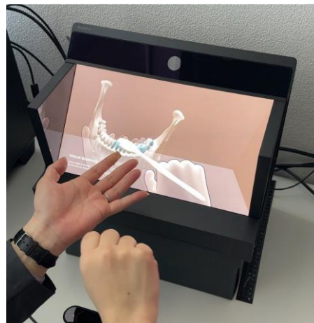
図 1: ブラッシング指導支援システムの動作の様子

そこで、本研究では裸眼立体視技術とモーションセンサーを併用し、患者に自身の歯列の 3D-CG と歯ブラシの動きを立体的に見せながら歯磨きを指導できるシステムを開発した。図 1 に本システムの動作の様子を示す。体験した複数の歯科医師および歯科衛生士による評価の結果、本システムの有用性が示唆された。