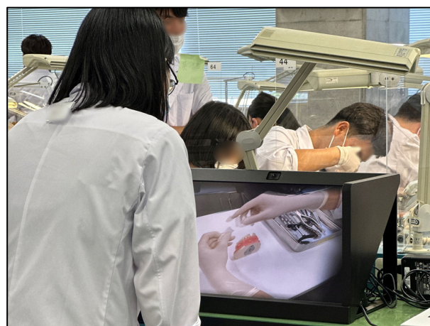
図 3: 実習において学生が閲覧している様子