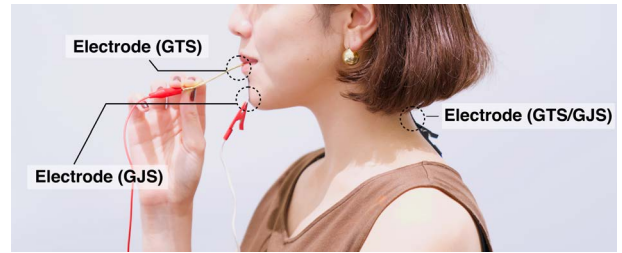
図 2: 実験参加者の電極配置

本実験では、顎部電気刺激によって舌部電気刺激と同様の辛味の増強効果が得られるかを検証するため、3つの実験刺激条件を設定した。顎部から舌部の神経線維を刺激する実験条件 (Anodal GJS) では最大電流値 2.5 mA, 持続時間 10s の陽極電気刺激を用いた [23]。また、辛味の増強効果が既に明らかになっている舌部電気刺激条件 (Anodal GTS) では、最大電流値 1.5 mA, 持続時間 10s の舌部への陽極電気刺激を用いた [24]。これらの電気刺激波形は、いずれも矩形波を用いた。また、電気刺激を行わないコントロール条件を設定した。