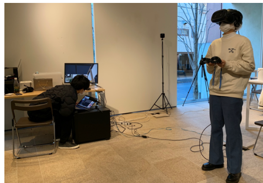
図4-1: 被験者(右)とVRオペレーター(左)