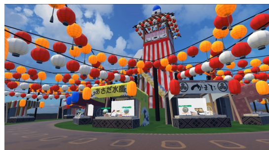
図 1-1 : 試作した「VR 道の駅」

しかし、観光という観点では、観光の入り口は特定の地名・名所・店舗へ訪問したいという欲求から始まり、その地域の名所・店舗に立ち寄る行動、あるいは計画を立てることが多い。観光ガイドのような書籍に代表されるように、観光は 1 つの情報から派生した情報を閲覧・検索可能な「集約化」したコンテンツがあり方として適していると言える。