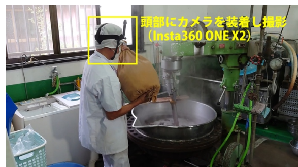
図 2-1: 生産者目線動画の撮影風景

仮想空間の構成は大きな円環状の道の両脇に観光・特産品の情報をシステム内コンテンツとして配置する、屋台型