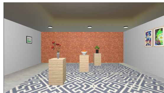
図 3: 香り提示中の VR 環境