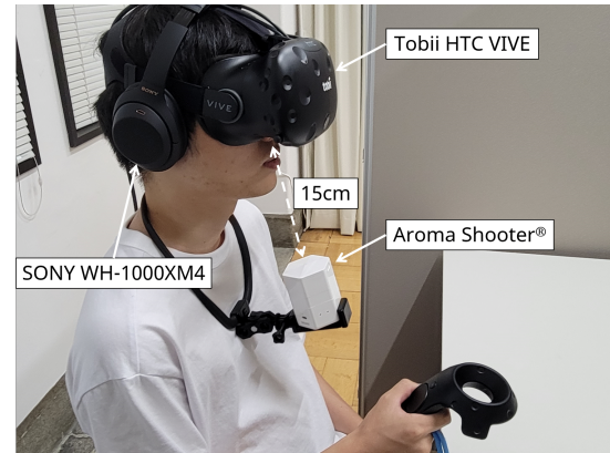
図 2: 現実の実験環境

VR 空間は、複数の香りが置いてある部屋を Unity3D で作成した。香りは嗅ぎ分けが可能なオレンジ、バラ、ミントの 3 種類を選択した。香りのオブジェクトはユーザカメラから約 1.4 m, 約 2.5 m, 約 4.0 m の位置に置かれた。VR 空間内でユーザのアバタは表示されない (図 3)。