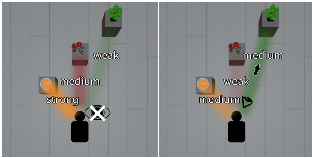
(a) 注目していない場合 (b) 注目している場合