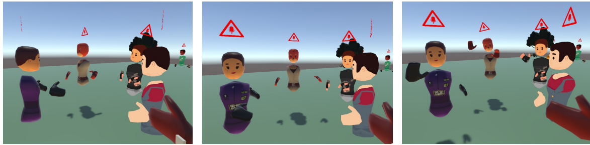
図 1: ソーシャル VR 空間において、既存ユーザに接近する際、既存ユーザは参加者に対して異なる反応を示す。左から、「Ignore」条件、「Notice」条件、「Welcome」条件。