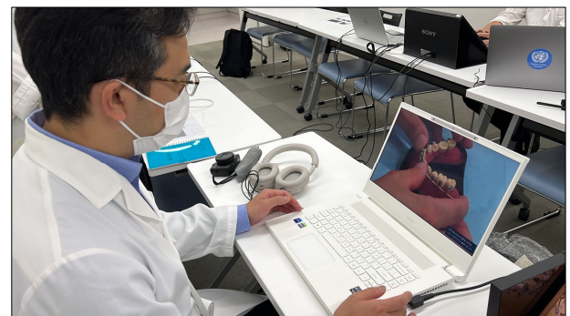
図 2: 歯科医師による評価の様子