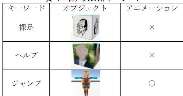
表 1: 音声入力用キーワード

クトを操作するために使用される。表 1 は本インタフェースの音声入力に対応したコマンドの例であり、利用者からこの表に定義された音声が入力されることで、対応するオブジェクトが生成される。