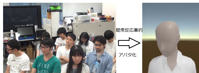
図 2: 聴衆映像と提示アバタのイメージ

聴衆全体の情報を少数のアバタという形に集約することにより、話者の聴衆把握における視認性は改善されると考