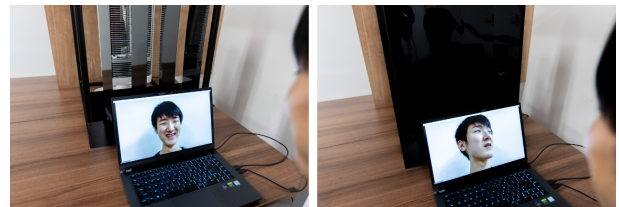
図2: 提案システムでは、相手が自分に視線を向けるほどフィンの隙間幅が大きくなり、強い温度提示を受ける。

ンの素材には、耐熱性の高いポリカーボネートを採用した。また、赤外線がフィンを透過するのを防ぐため、フィンの片側には厚さ0.09 mmのアルミテープを貼付した。各フィンの回転には、トルク0.21 N·m、角速度5.51 rad/sのサーボモータ(型番: Futaba RS204MD)を使用した。各フィンは、片側を軸受でアルミフレームに接続し、もう片側をサーボモータに接続した。サーボモータの回転角度はマイクロコントローラ(型番: Arduino Uno R3)からのPWM信号によって制御した。温度提示装置全体の幅・高さ・奥行きは、それぞれ500 mm・780 mm・700 mmで、総ワット数は1.15 kWであった。