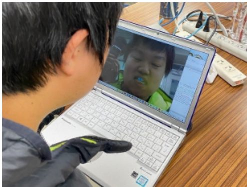
図 1: 実験の様子

適切に歯の汚れやすい部分が検出さればい菌のイラストが正常に表示されることを確認した(図 1、2)。また、暗い場所では歯の検出を行えないことがあった。このシステムの動作速度は 2.04fps である。