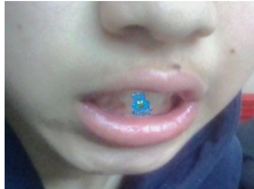
図 3: ばい菌の重畳表示 (歯と歯の間)